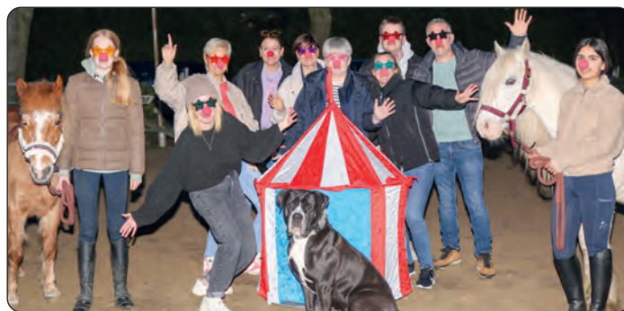
Das Organisationsteam präsentiert ein tolles Programm für die ganze Familie.

Musikalisch bieten Honky Tom, die Stereonauten und Stage Students eine Show der Superlative. Dazu gibt es eine Feuershow. Auch finden wieder Versteigerungen statt – alle Pakete haben einen Wert von mindestens 30 Euro, meist noch viel mehr. Zudem kommen die Fundsa-