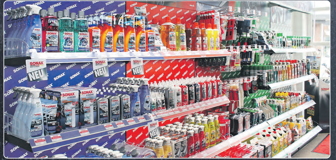
Am Tag der offenen Tür am 30. April ab 14 Uhr können sich alle Interessierten vom umfangreichen Leistungsangebot überzeugen.