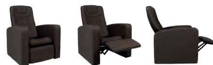
Neue Kino-Sessel im Dersa Kino Damme