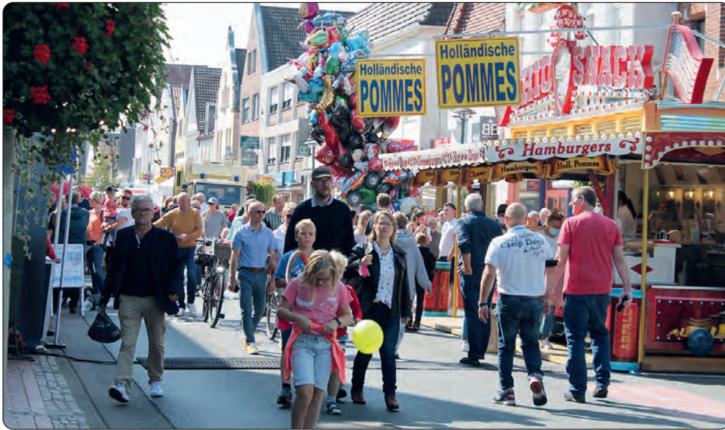
Ein Besuch in der Innenstadt lohnt sich. Verkaufsoffen ist der Sonntag, 28. April, von 13 bis 18 Uhr.