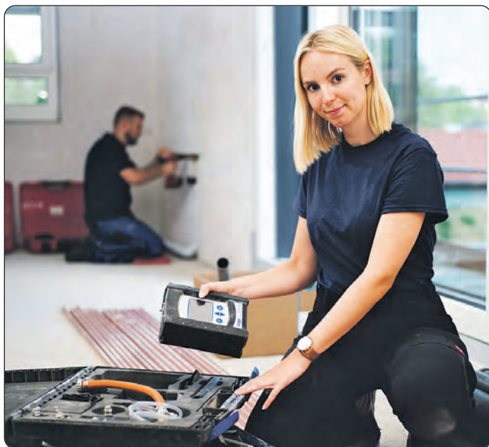
Eine Anlagenmechanikerin SHK ist ein Universaltalent: Sie hat alles im Griff, was mit Wasser, Wärme und Luft in Gebäuden zu tun hat. Die Ausbildung ist entsprechend vielseitig und interessant.