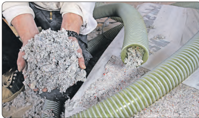
Ein Einblasdämmung ermöglicht eine gleichmäßige Isolierung.

wie beispielsweise dem Einbau von Dämmplatten, spart dies viel Zeit und Aufwand. Hervorzuheben sind außerdem die hohe Dämmleistung der Einblasdämmung. Das verwendete Material, wie zum Beispiel Zellulosefasern oder Mineralwolle, hat eine sehr gute Wärmedämmung. Dadurch kann der Wärmeverlust im Haus effektiv reduziert werden. Im Winter bleibt die Wärme im Haus und im Sommer bleibt die Hitze draußen. Das sorgt für ein angenehmes Raumklima