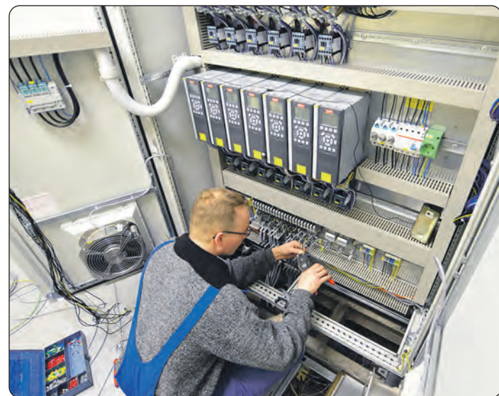
Blick in die Technik: Elektroniker bei der Arbeit vor einem Schaltschrank.

gieversorgung und -optimierung. Die Azubis erhalten Kenntnisse über verschiedene Schalt- und Steuerungstechniken, die Installation von Beleuchtungsanlagen, Sicherheitssystemen sowie die Überprüfung und Wartung von elektrischen Anlagen. Nach erfolgreichem Abschluss der Ausbildung stehen den Elektronikern verschiedene berufliche Perspektiven offen. Sie können beispielsweise in Elektroinstallations- und Energieversorgungsunternehmen, in der Gebäudeautomation oder in der Industrie tätig werden. Darüber hinaus bieten sich auch Weiterbildungsmöglichkeiten zum