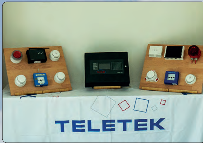
Eine Brandmeldeanlage (Mitte) und verschiedenen Warnmeldermodelle gibt es zu Schulungszwecken in den neuen Räumlichkeiten.