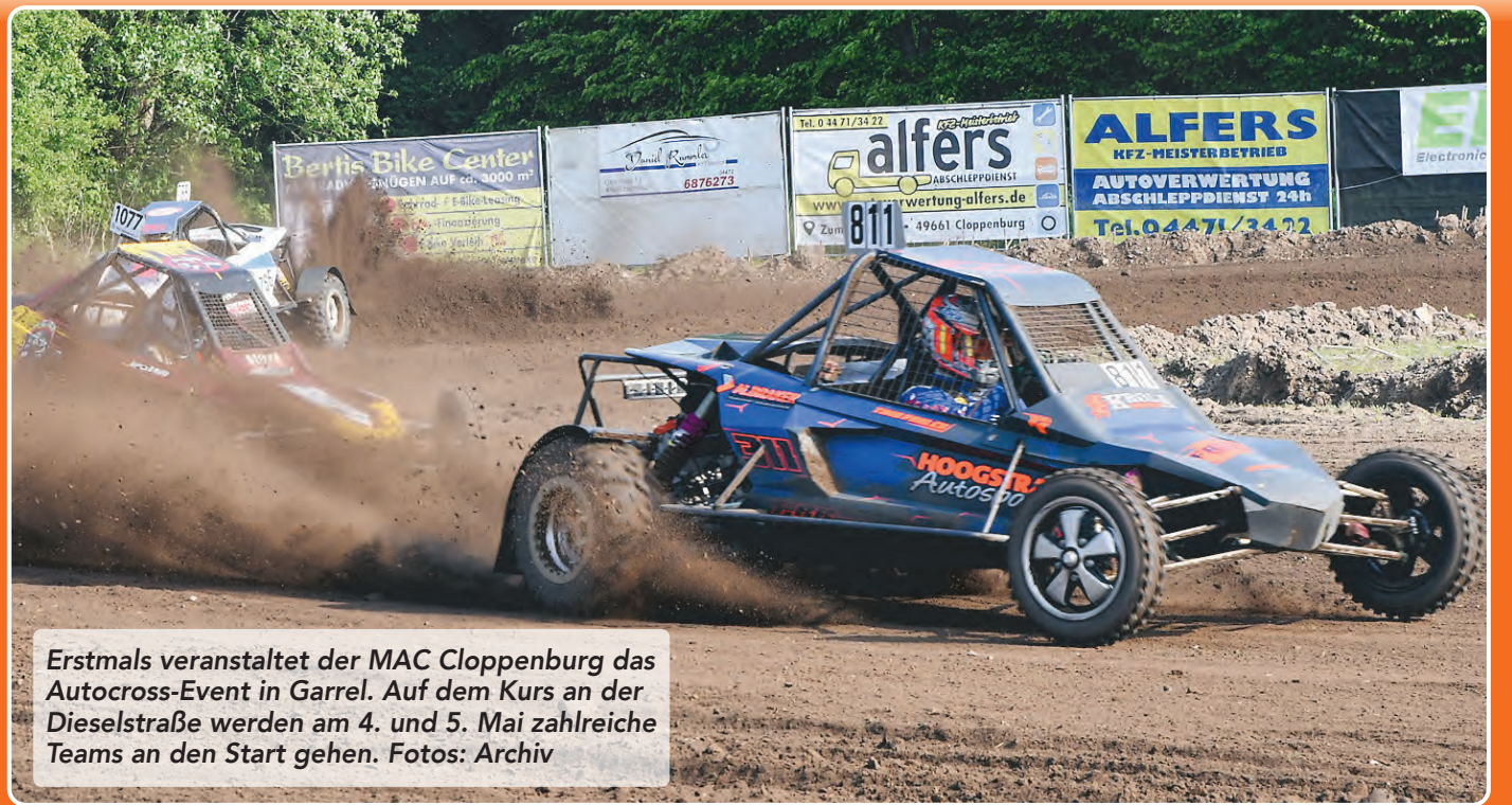
Erstmals veranstaltet der MAC Cloppenburg das Autocross-Event in Garrel. Auf dem Kurs an der Dieselstraße werden am 4. und 5. Mai zahlreiche Teams an den Start gehen.