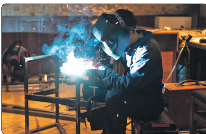
Auch das Schweißen ist ein wesentlicher Arbeitsbestandteil eines Metallbauers.