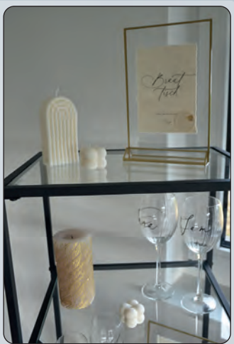
Ob komplette Deko oder „nur“ Einladungen, Stephanie Budde gestaltet Hochzeitpapeterie mit viel Liebe.

de am neuen Standort an der Ecopark-Allee 22 sowie weiterhin unter Tel. 0176/57831750 oder per Mail an info@designbudde.de.